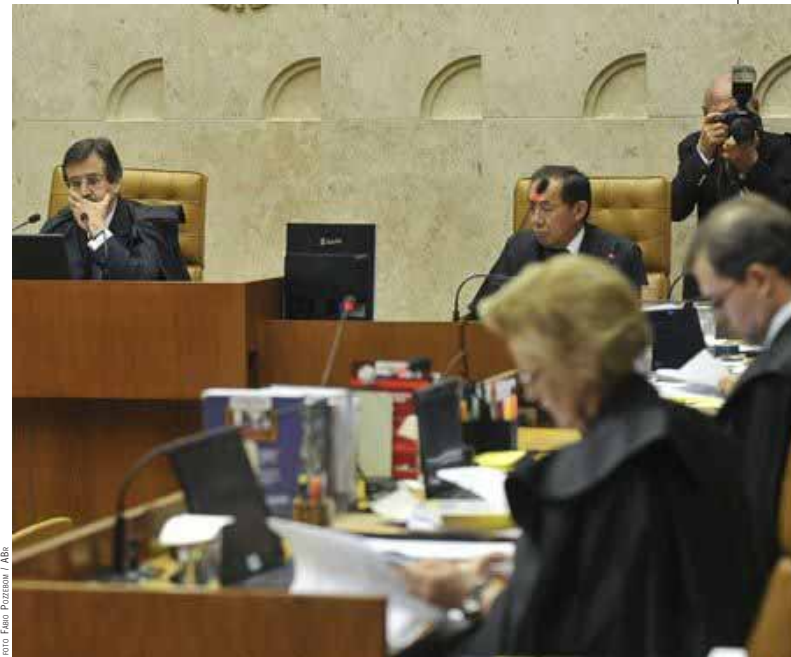
STF abre o ano judiciário: ministro Cezar Peluso (à esquerda) tenta contornar a crise.