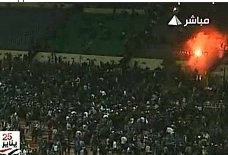
Port Said, Egito: invasão de campo, guerra no gramado — e 74 mortes.