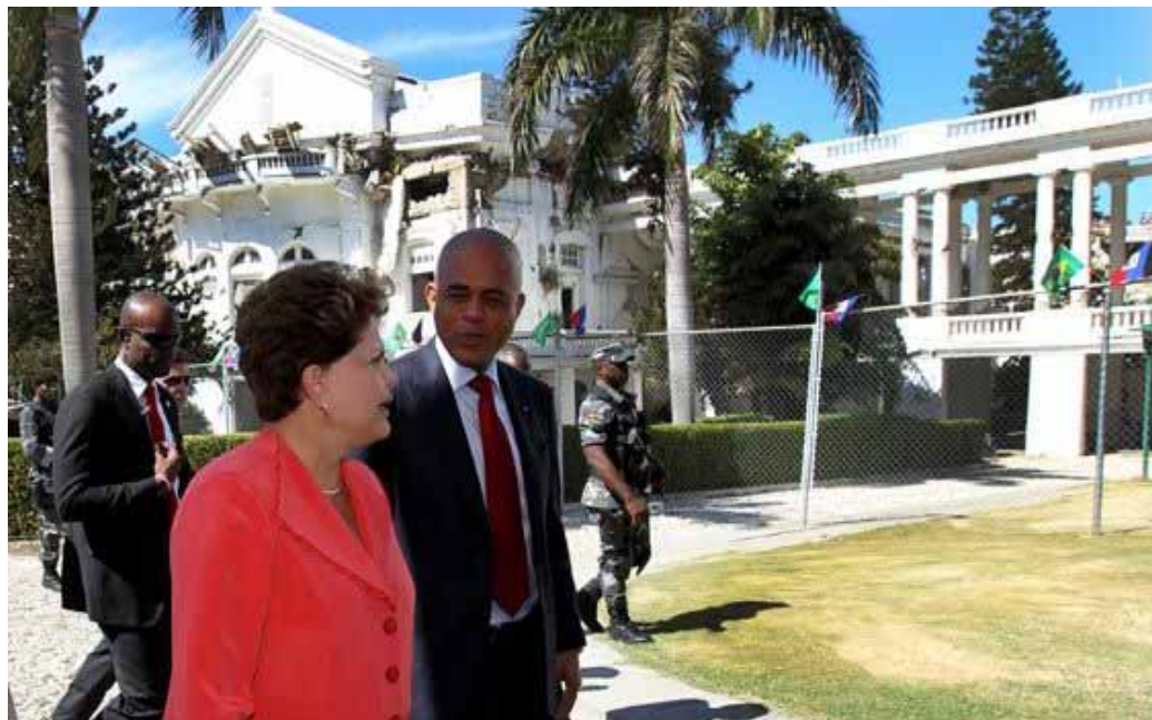
Dilma com seu colega haitiano Michel Martelly: promessa de ajuda e resolução do problema dos imigrantes no Brasil.

BLOGUEIRA YOANI SÁNCHEZ, DE CUBA, LAMENTANDO QUE A PRESIDENTE DILMA NÃO TIVESSE FALADO PELOS DIREITOS HUMANOS QUANDO DA VISITA AO PAÍS.